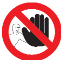
DIVIETO DI ACCESSO ALLE PERSONE NON AUTORIZZATE