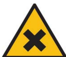
SOSTANZE NOCIVE O IRRITANTI