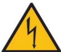
TENSIONE ELETTRICA PERICOLOSA