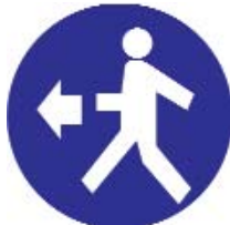
PASSAGGIO OBBLIGATORIO PER I PEDONI A SINISTRA