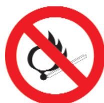
VIETATO FUMARE O USARE FIAMME LIBERE