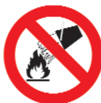
DIVIETO DI SPEGNERE CON ACQUA