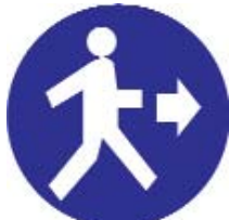
PASSAGGIO OBBLIGATORIO PER I PEDONI A DESTRA