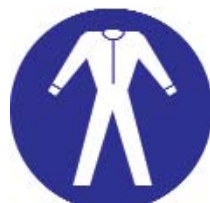
PROTEZIONE OBBLIGATORIA DEL CORPO